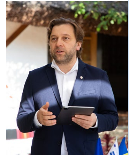
Dumitru ALAIBA, Viceprim-ministru, ministrul Dezvoltării Economice și Digitalizării.

Cu respect, Dumitru ALAIBA, Vicepremier, Ministrul Dezvoltării Economice și Digitalizării