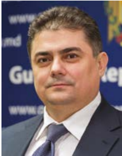
Octavian CALMĂC, Viceprim-ministru, Ministrul Economiei al Republicii Moldova