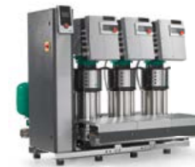
Wilo-SiBoost Smart Helix EXCEL

+ 37 36 9111 797 | + 37 32 2223 501 www.wilo.ro