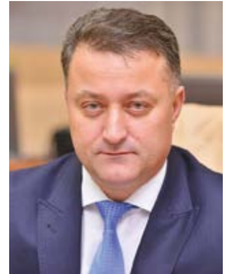
Vasile BĂTCA Ministrul Dezvoltării Regionale și Construcțiilor din Republica Moldova

I am convinced that MOLDCONSTRUCT will boost the work of all players in the field and will be an effective communication platform for creating new conditions for sustainable development of the construction industry.