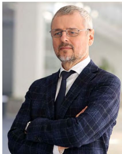
Sergiu PRODAN, Ministrul Culturii al Republicii Moldova